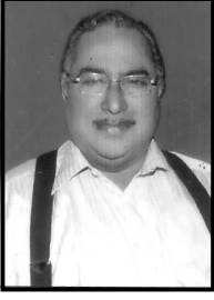
సేకరణ: రెవ.డా॥ కె.ఛోసఫ్